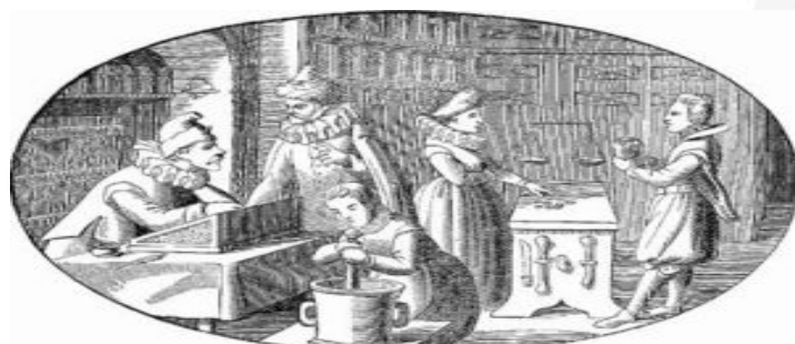
INTERIOR OF AN APOTHECARY'S SHOP. Late XIV, or Early XV, Century. Finnish. (From an Old Painting.)

Quem, sem ser farmacêutico, explore farmácia ou exerça actividade reservada às farmácias, explore laboratório de produtos farmacêuticos ou estabelecimento de comércio por grosso de medicamentos, sem o competente alvará, é punível com prisão de 3 meses a 2 anos e multa. Tratando-se de farmacêutico, a pena é a de prisão até 6 meses e multa.